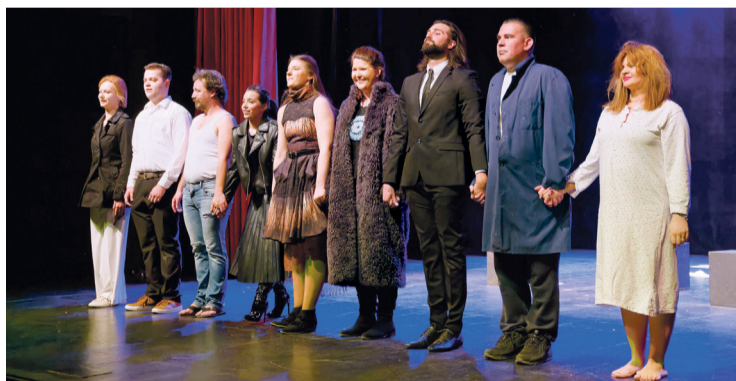
Predstava 'M.A.R.Š.' pokazuje da Gaudeamus ne gubi kreativno i britko preispitivanje društveno relevantnih tema

Za prvu predstavu „Sretni dani“ (1978.) glazbu je komponirao i pjevao Krešimir Blažević, osnivač po-