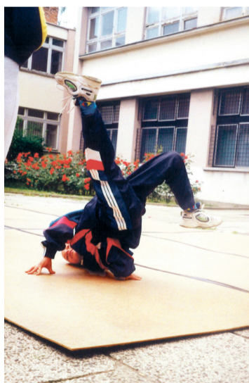
U Centru su stasali neki od danas najpoznatijih breakera

za grafiti scenu, nego i za Zagreb popraćen koncertima uglednih DJ-a i nastupima plesnih skupina urbanih plesova. Nakon Rotor Hall of Famea , koji je ostao najveći gradski prostor za oslikavanje, dobivale su se dozvole za manje površine, poput Atomskog skloništa u Folnegovićevu naselju.