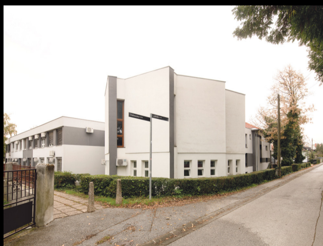
Zgrada Centra KNAP sa stražnje strane, s Moslavačkog traga, pruža pogled na koncertnu dvoranu