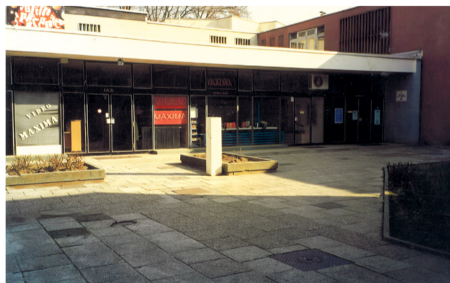
Nekad su gotovo svi prostori bili u najmu, od videoteke, autoškole...

Kada sam tek došao, Centar je izgledao strašno, kao da je bomba pala. Najprije sam zamolio dečke iz tehnike da okreće zidove. Godinu i pol nakon mog dolaska dobili smo novac za obnovu. Sjećam se da su se tijekom adaptacije u kanalima za ventilaciju zapalila zrnca prašine i došlo je do požara. Srećom da smo imali osiguranje pa smo novac od osiguranja uložili u grijanje u dvorani. Imali smo šest reflektora i dva projektora za emitiranje 35-mili-