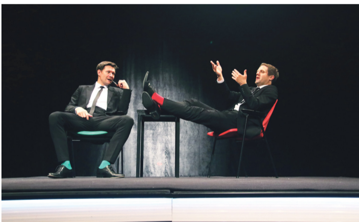
'Play Harms ili sasvim obične besmislice' premijeru je imala usred pandemije