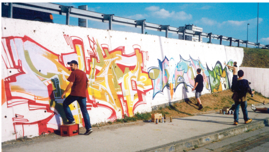
Na inicijativu KNAP-a grafiteri su oslikavali prostor kod rotora

Prve legalne površine, koje su mogli oslikavati odabrani umjetnici ( Hall of Fame ), bile su na zgradi Centra, potom i škola u četvrti, a veliki je događaj bio 2001. kada je, na inicijativu i u organizaciji Kulturnog centra Peščenica, dvadesetak uglednih grafitera oslikavalo više tisuća četvornih metara zidnih površina na rotoru u Savskom gaju. To je bio velik događaj, ne samo