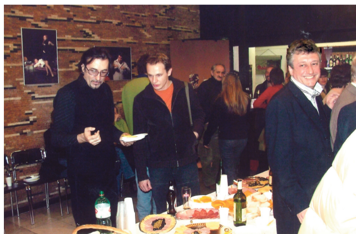
Slavlje nakon prve KNAP-ove profesionalne produkcije

KNAP je bio među pionirima urbane umjetnosti pa su tu, među ostalima, poznati grafiteri pronašli svoje mjesto za stvaranje