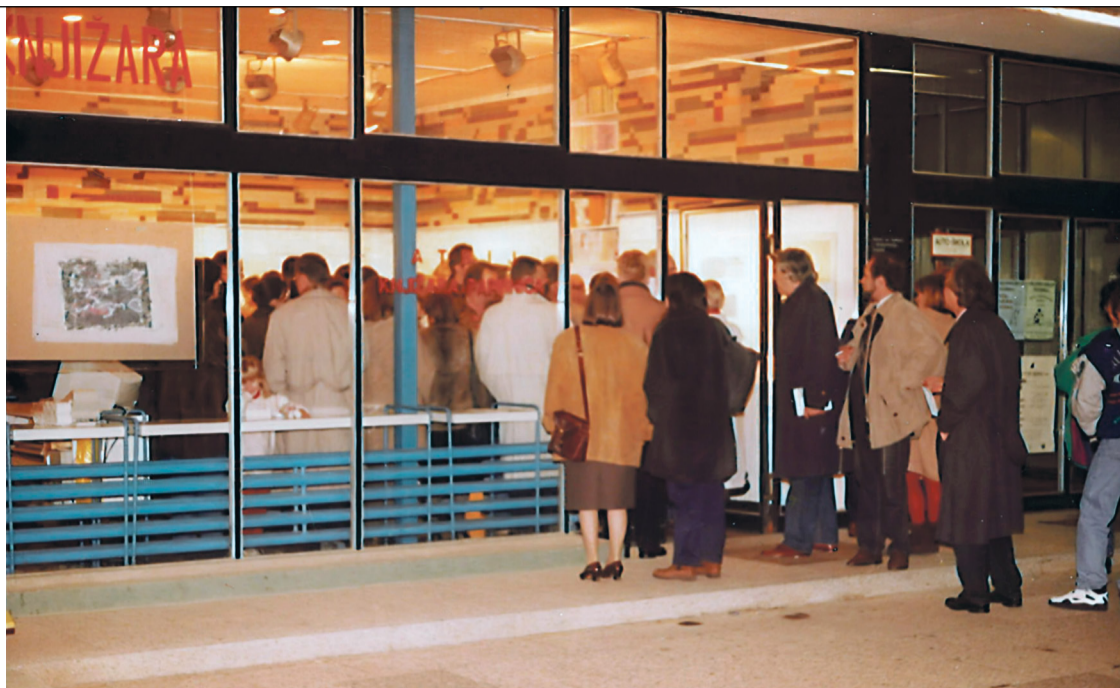
Galerija Događanja postala je kultno mjesto vizualne kulture