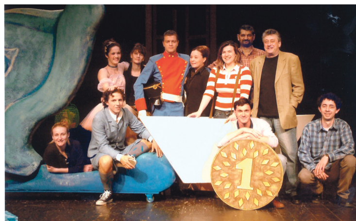
Kreativni tim predstave 'Postojani kositreni vojnik'