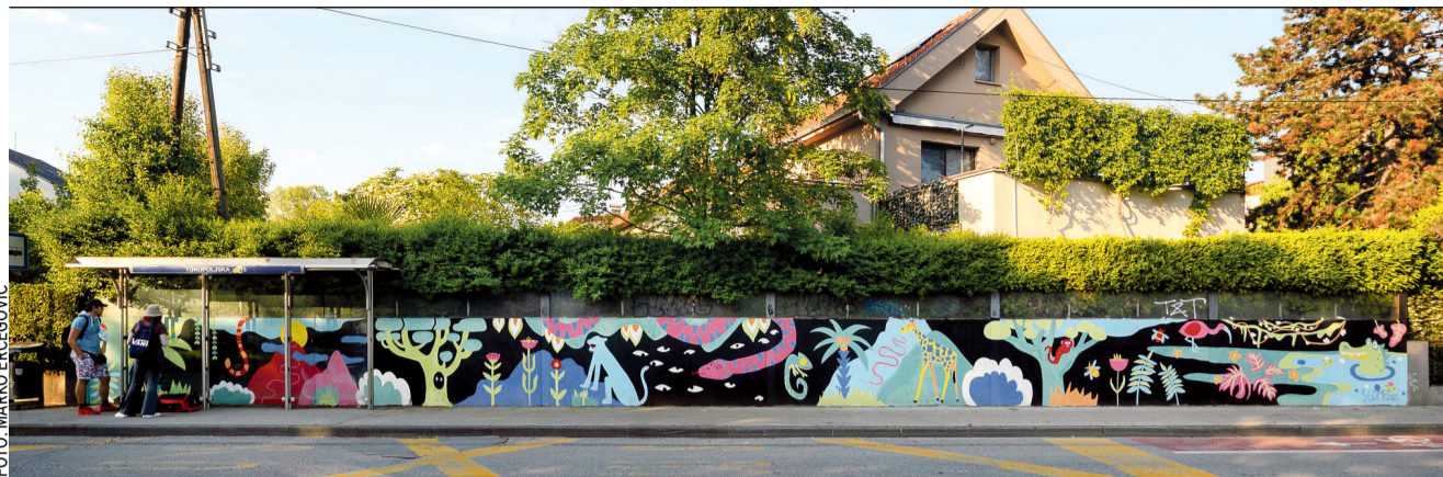
Mural na Borongajskoj ulici u sklopu programa Volim Pešču realiziran je sa Školom za grafiku, dizajn i medijsku produkciju