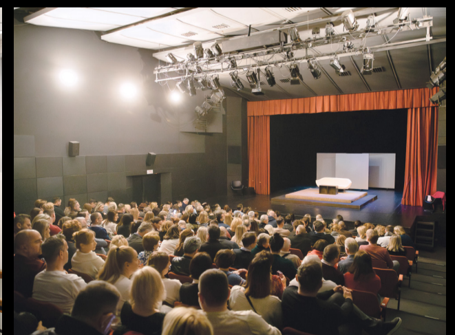
KNAP-ove hit predstave redovno punu dvoranu, čak i one koje su na repertoaru gotovo deset godina