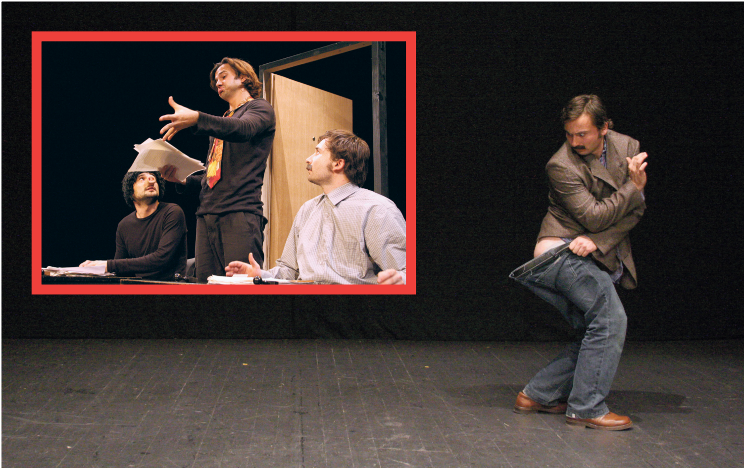
'Smisao života gospodina Lojtrice' slovi za kultno djelo, a do svoje zadnje izvedbe imalo je krcatu dvoranu