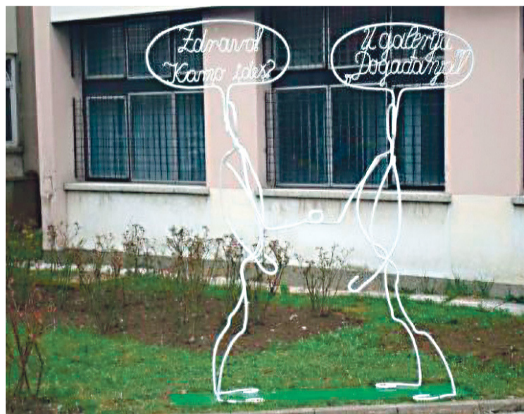
Trodimenzionalni strip Nade Orel postao je jedno od najprepoznatljivijih djela Centra

"Budimo prijatelji" poruka je koja je moto ove moje akcije', zapisala je na letku umjetnica Nada Orel sa željom da Park Mali princ bude prostor zajedništva i umjetničkog izraza