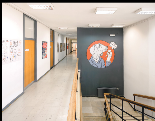
Mural na zidu stepeništa koji vodi do ureda zaposlenika oslikao je umjetnik Boris Bare