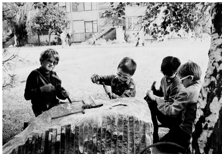
Djeca klešu u Parku Malog princa 1985.