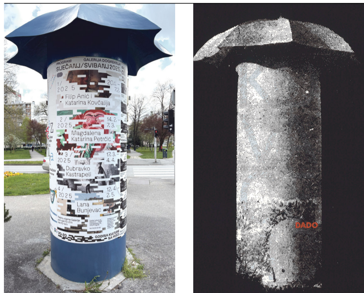
KNAP-ovi kišobrani danas su obnovljeni, ali uvijek izvor informacija za sugrađane