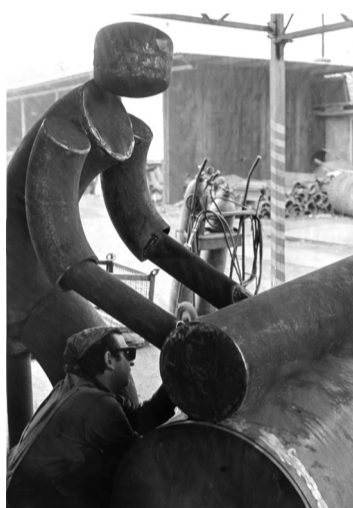
Skulptura 'Kriolo materino' Mile Kumbatović iz 1980. godine ukradena je iz atrija Centra i nikad nije pronađena